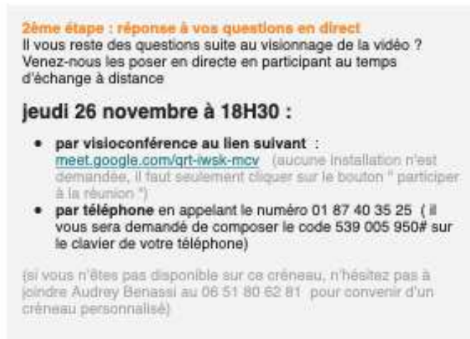
Capture d'écran de l'invitation à l'atelier riverain à distance

- La vidéo et la présentation support utilisée pour cette dernière sont disponibles en annexe -