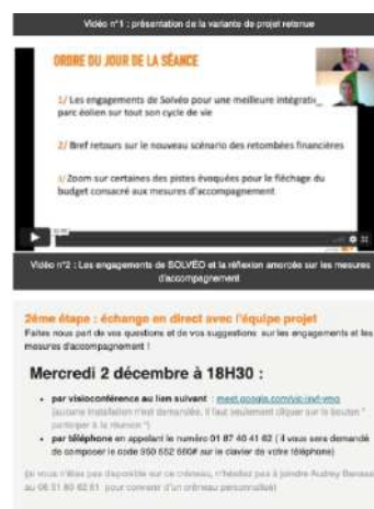
Mail d'invitation à l'atelier à distance